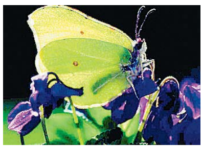
Zart und schön: der Zitronenfalter.

Ziel der saarland- und bundesweit veranstalteten „Abenteuer Faltertage“ war es, die Bestandschwankungen der Tagfalter sowohl regional als auch im Jahresvergleich zu ermitteln. Nächstes Jahr will der BUND Saar erneut zur Schmetterlingszählung im Saarland aufrufen, ein genauer Termin steht aber bislang noch fest. bera